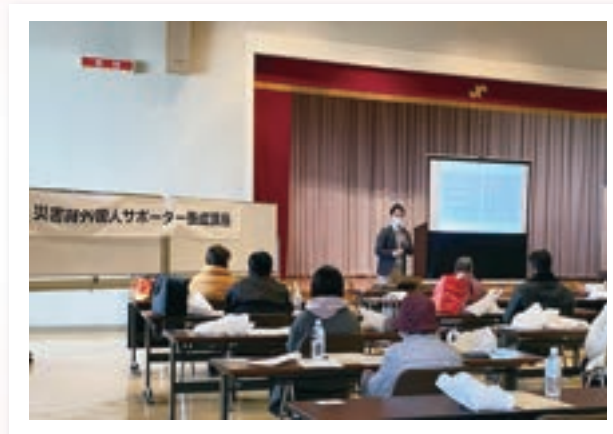
P.5 災害時外国人サポーター養成講座