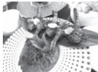
エビマサラカレー

大人気メニュー。思わず「幸せ!」と叫びたいほどの美味しさ。パラタ(写真右上。モチモチの薄いパン)と共にいただくと更に感動します。好みの辛さを選べますよ!