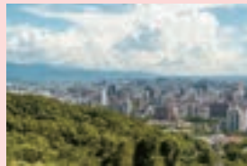
虎頭山から望む桃園市

現在は新型コロナのため往来が困難ですが、交流が止むことなく、オンラインなどでやり取りを続け、都市間の友情を育ててまいります。