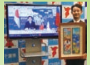
知事と市長のウェブ会談 (2021年8月9日)

本年度は、ウェブ会談のほか、千葉県、桃園市それぞれの地でお互いの魅力をPRするなど、往来再開後の交流が充実したものになるよう、取り組んでまいりました。今後も、桃園市と協力し、知恵を出し合いながら交流を進めてまいります。