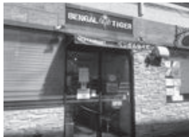
千葉駅より徒歩7分。閑静な住宅街にあります。

インド出身のシェフが腕を振るう千葉県屈指のインド、アジア料理店。インドのホテル、マレーシアで複数の受賞歴のある5つ星ホテルのインド料理ヘッドシェフなど豊富な経験をもつシェフによるおしゃれで洗練されたモダンな料理は老若男女を問わず大人気。