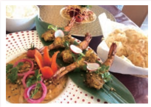
P.2~3 まちで見つける世界の扉 ~千葉市編~