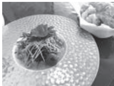
バターチキンカレー

大人気メニュー。思わず「幸せ!」と叫びたいほどの美味しさ。パラタ(写真右上。モチモチの薄いパン)と共にいただくと更に感動します。好みの辛さを選べますよ!