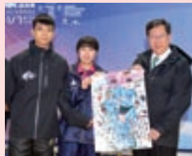
卓球交流 (2018年1月、桃園市にて)